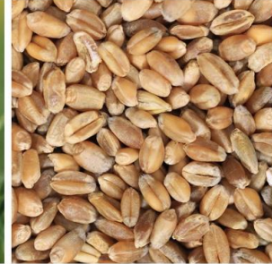
Viljan toimitus Fazer Myllylle