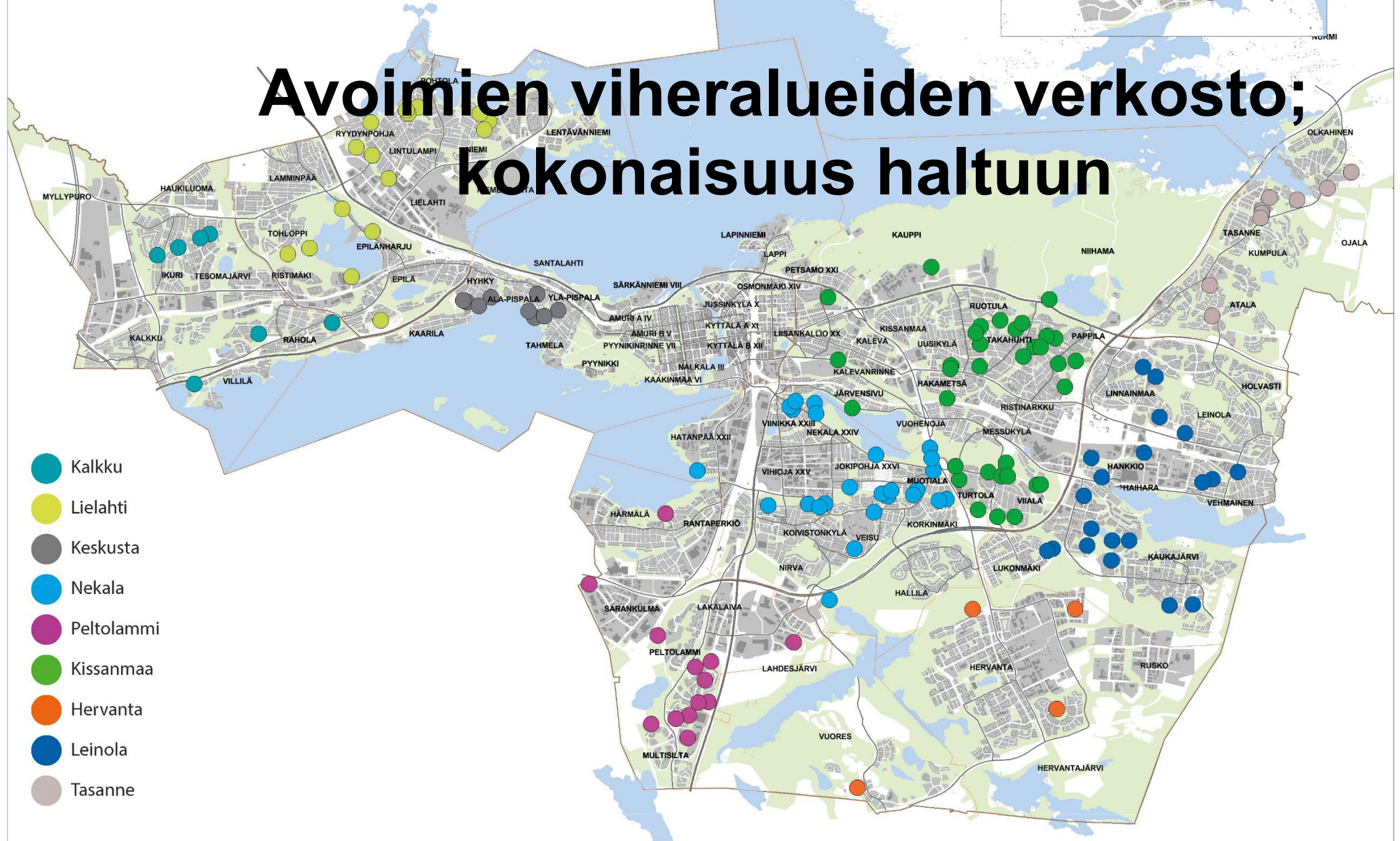
Kartta 1. Nykyiset B-hoitoluokan kohteet urakka-alueittain